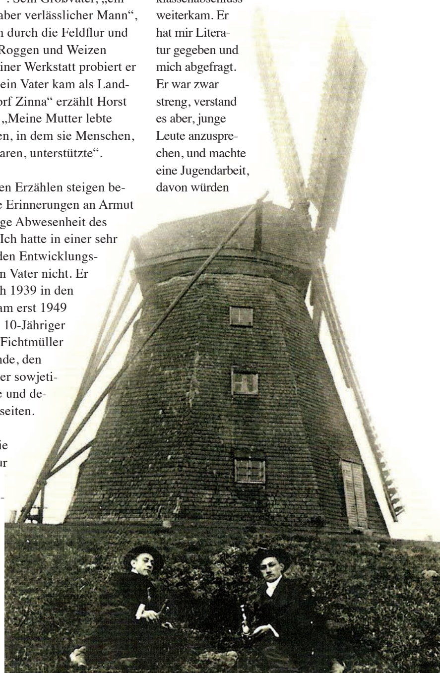
Greiffenberger Mühle vor 1914