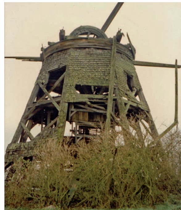
Greiffenberger Mühle Mitte der 1990er Jahre